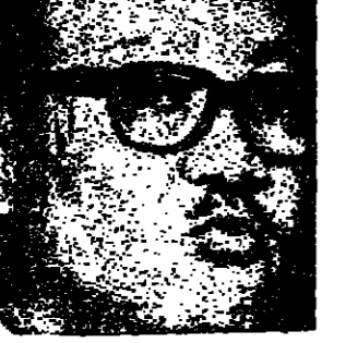
عن ( آيت ديز )

تضع السودان الازلمسلة دولة من التغييرات الديموقراطية ، فالي جانب التخلف الثقافي والاجتماعي الذي ينشر بين السكان رضيت السودان بان تكون لها لياوة اللاجئين القادمين من مختلف المناطق الافريقية المجاورة . وقد شعرت الحكومة السودانية بوجبة هذه الشكلة الحادة فقررت اعتبار عام ١٩٨٠ «عام للاجئين» وبلغ عدد اللاجئين داخل البلاد حوالي ٤٠٠٠٠٠ لاجئ منهم ٣٥٠٠٠٠ لاجئ من اريتريا واوغندا و ٥٠٠٠٠ لاجئ من افريقيا الوسطى .